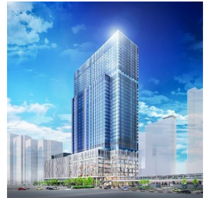
建物外観イメージ（JR大阪駅前から）