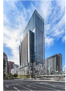
建物外観（JPタワー大阪） イメージ