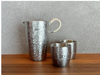
錫の酒器セット イメージ